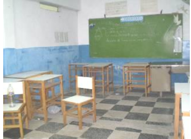
Aulas donde se dictan las clases de E.P.A. y B.L.A.