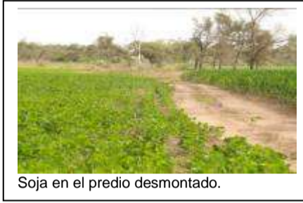
Soja en el predio desmontado.

Los carteles instalados en los campos resaltan los planes de deslindes perimetrales y transversales para mejoras. En ellos se hace figurar la autorización dada por Bosques, la disposición y el número de permiso, además del técnico responsable y la empresa de desmonte. Lo que llama la atención, entre varios aspectos muy peculiares además del fraude, es que actúa la oficina forestal de Pampa del Infierno, a pesar de que el plan autorizado se debe ejecutar en el sudoeste chaqueño.