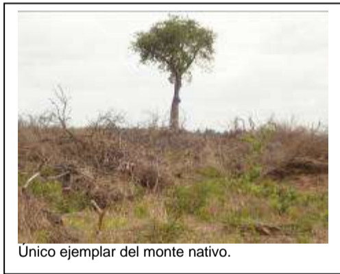
Unico ejemplar del monte nativo.

Según la ley 6.409, de ordenamiento territorial del bosque nativo chaqueño, no se exige la realización de estudios de impacto ambiental para la autorización, permiso y ejecución de los planes de limpieza de invasoras hasta 300 hectáreas. Estos planes se ejecutan como cualquier otro permiso simple y el arancel que se paga por hectárea es único y muy bajo; es del 4 % por hectárea, independientemente de la superficie solicitada, que es mucho más barato que los aranceles que se deben pagar para desmontar con el objeto de cambio de uso del suelo, que arrancan en el 8 % y terminan en 24 %, según la superficie a desmontar.