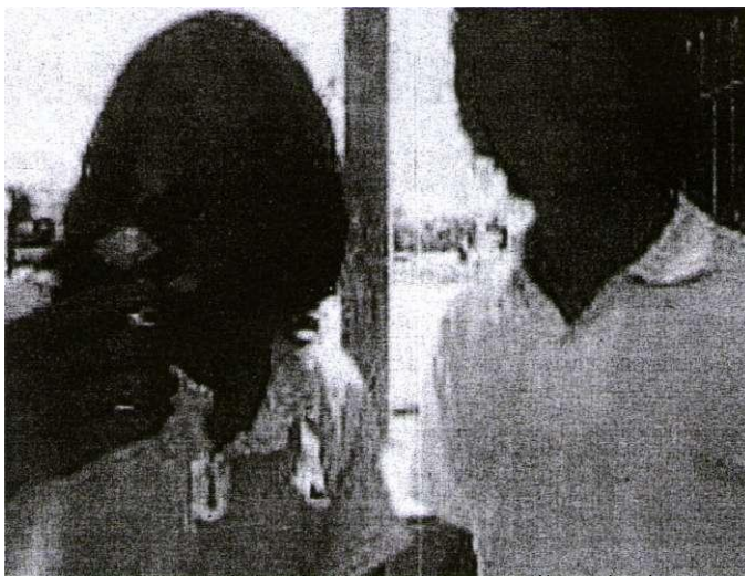
ARMADOS. Uno de los jóvenes muestra un revólver a la cámara.

jóvenes de tirar huevo y harina a quienes cumplen años, según la tradición, cuenta Yanina.